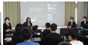
山形日産グループ