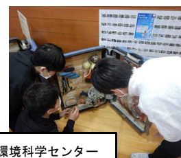
環境科学センター